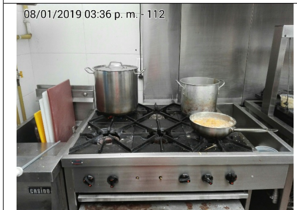
FOTOGRAFÍA N°. 3 ESTUFA DE 6 PUESTOS