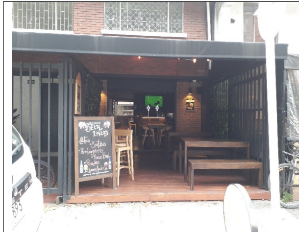
FOTOGRAFÍA N°. 1 FACHADA DEL PREDIO