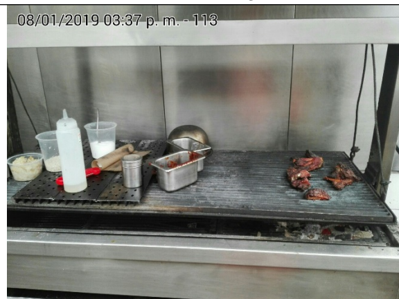
FOTOGRAFÍA N°. 4 PARRILLA