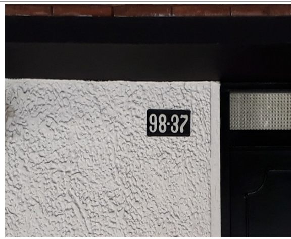
FOTOGRAFÍA N°. 2 NOMENCLATURA DEL PREDIO